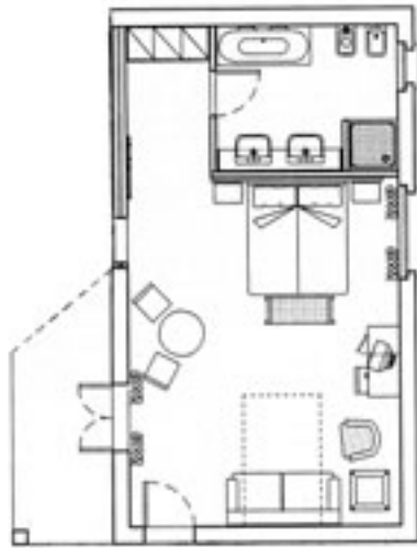
GARDEN SUITE - MQ. 35