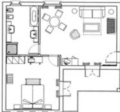
SUPERIOR SUITE - MQ. 55