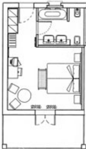
JUNIOR SUITE - MQ. 26